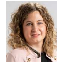
Responsable de comunicación: Lourdes Lorenzo Sierra